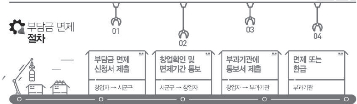
부담금 면제신청서 양식 : 창업지원법 시행규칙 제9호 서식